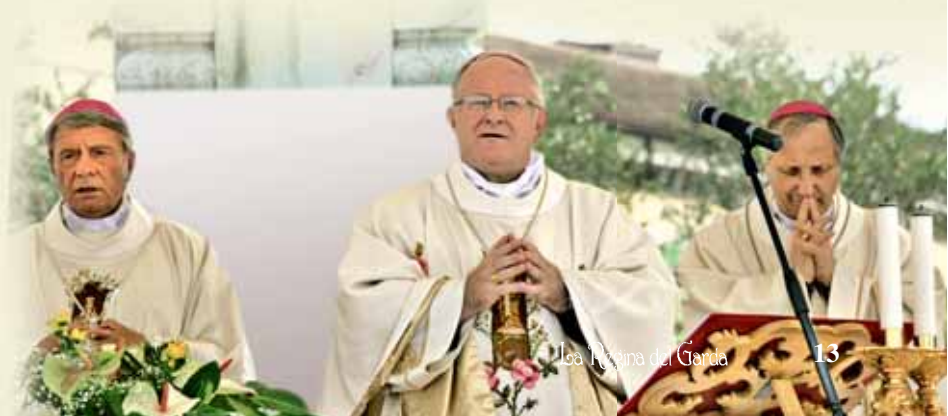
Celebrazione Eucaristica dei Vescovi nella piazza del Porto

A nome anche degli altri vescovi, con cui condividiamo le preoccupazioni pastorali, lancio il grido di allarme: i nostri giovani, e quelli che confluiscono sul lago per puro divertimento, anche da trend, sono in pericolo naufragio valoriale! Solo insieme e con il coinvolgimento di loro stessi sarà possibile il recupero di generazioni che hanno diritto ad un oggi a ad un domani carico di promesse. Affidiamo poi le famiglie, specialmente quelle in travaglio a causa di infermità, di disgregazione o di disoccupazione. Affidiamo gli anziani, che amiamo pensare con la corona in