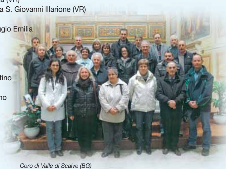
Coro di Valle di Scalve (BG)

I Cori delle parrocchie di S. Martino e S. Benedetto e del B. Andrea di Peschiera del Garda che hanno animato la S. Messa al Porto il 5 settembre.