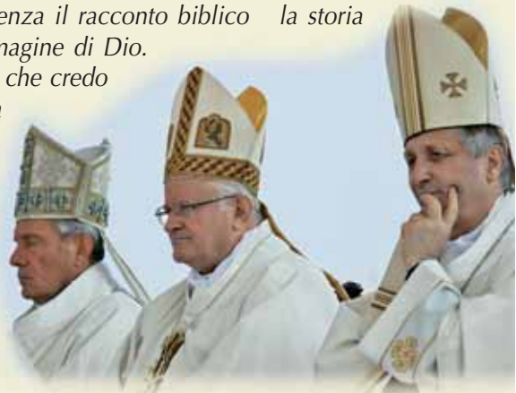
I Vescovi di Brescia - Verona - Mantova

Con tali sentimenti siamo desiderosi d'accogliere la Parola di Dio aiuto prezioso per il cammino che siamo consci d'avere davanti, noi oggi che viviamo con fede e stupore l'anniversario di Maria, Regina del Garda.