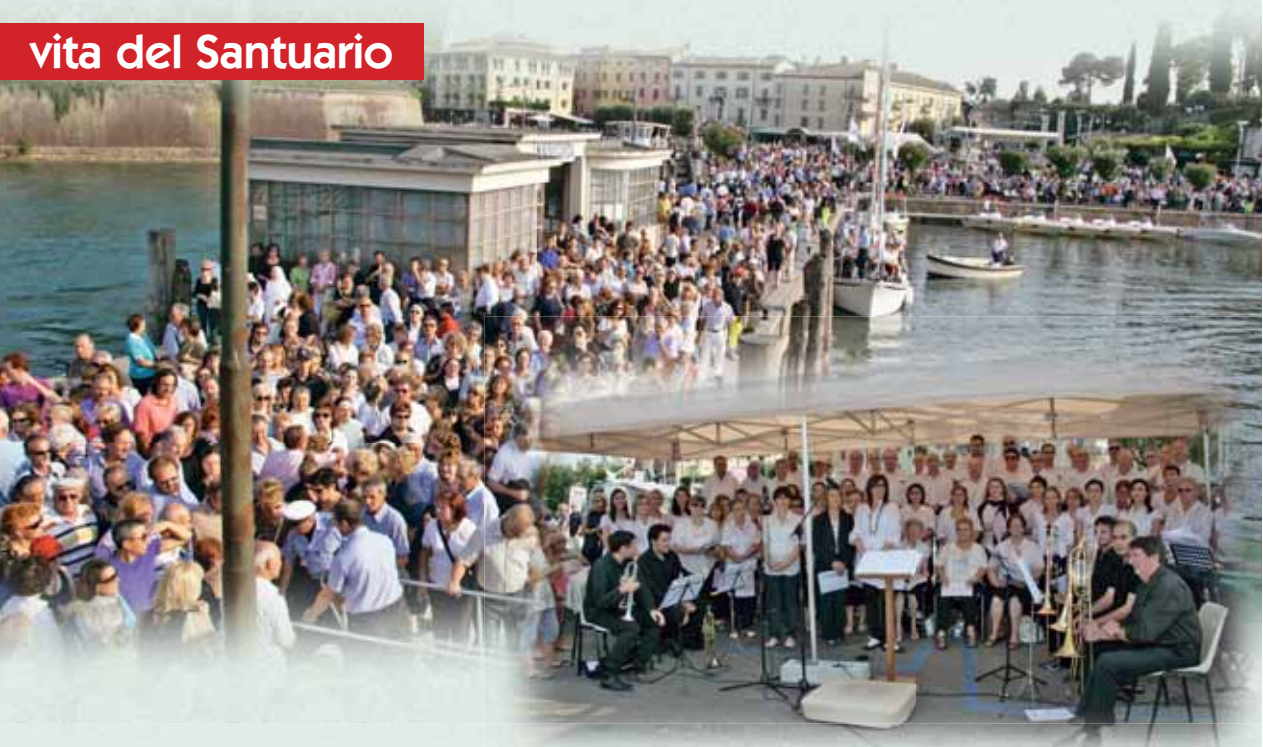
Coro di Peschiera del Garda

Tutti possiamo riflettere su questi spunti per trovare motivazioni valide per rispettare il creato, luogo della nostra vita. Essere riconoscenti a Dio per le cose affidate all'uomo è un dovere e una grazia per tutti.