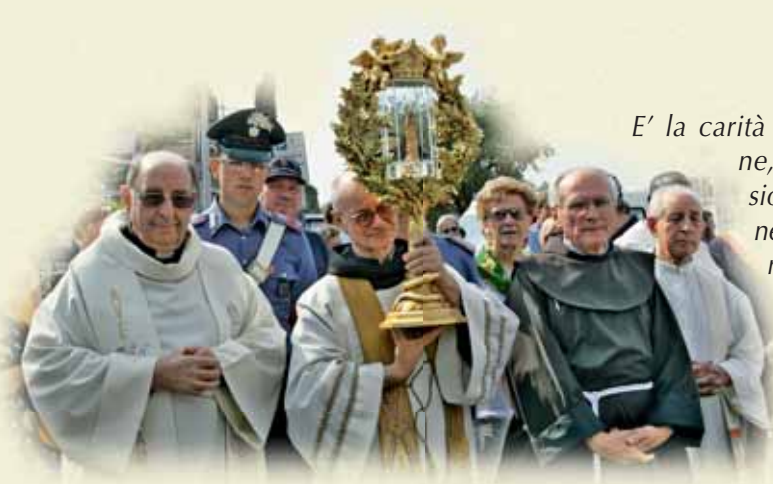
La Madonna del Frassino in processione a Peschiera

E' la carità che è partecipazione, condivisione, denuncia dell'ingiustizia, avversione per l'indifferenza, rivendicazione della vera umanità, assunzione di responsabilità, consapevolezza del bene comune che cambia il mondo. Quella carità che San Paolo diceva "che non gode dell'ingiustizia ma si rallegra della verità, tutto crede, tutto spera, tutto sopporta".