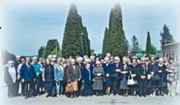
Associazione III° Età Zevio (VR)

Pellegrinaggi dall'estero: da Basilea (Svizzera) un pullman dalla Repubblica Ceca un pullman dalla Polonia un pullman quattro pullman sono giunti dalla Germania