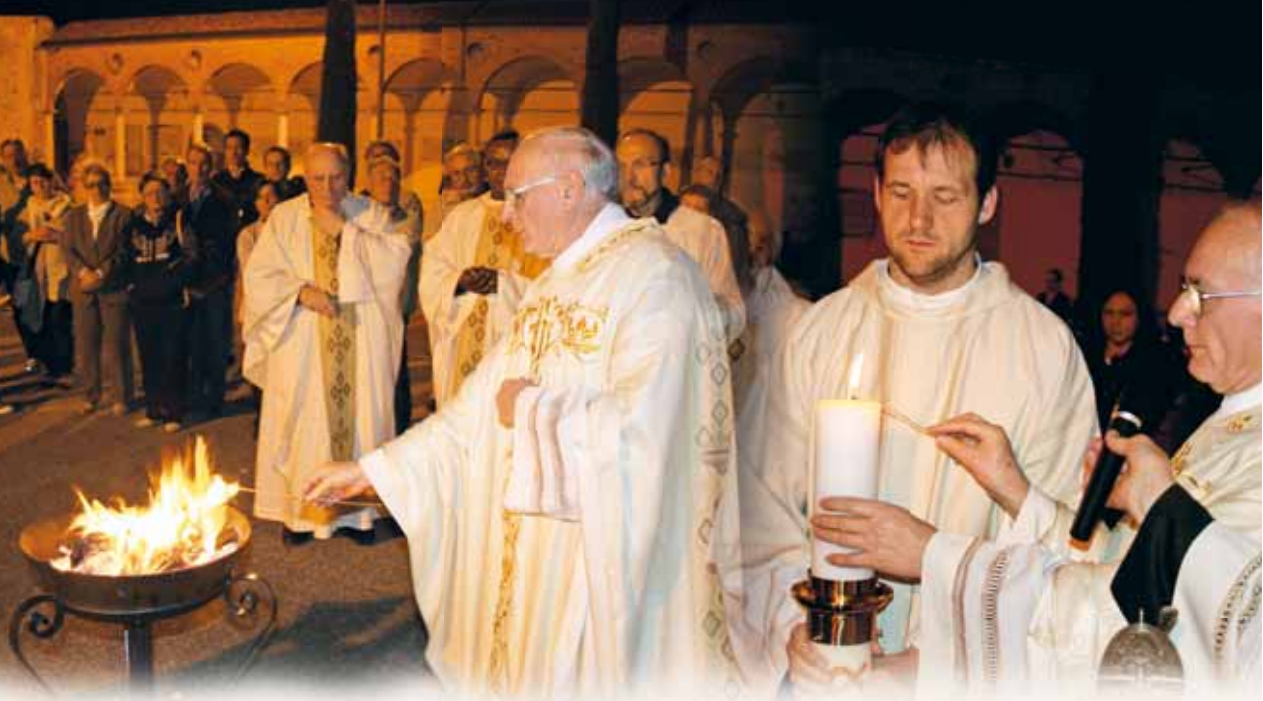
Benedizione del fuoco