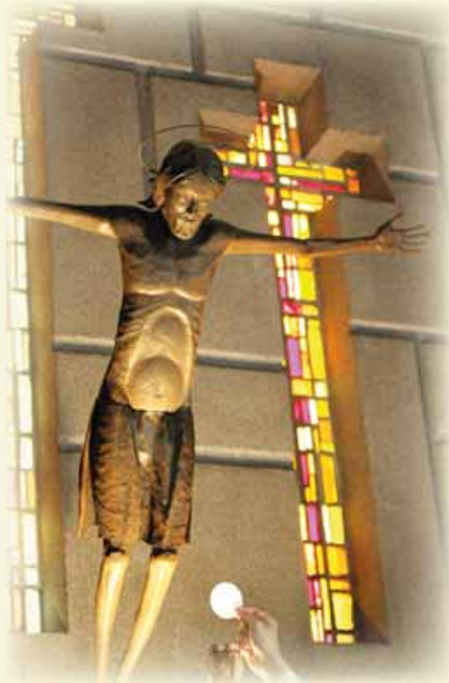
Crocefisso nella cappella delle confessioni Santuario del Frassinò