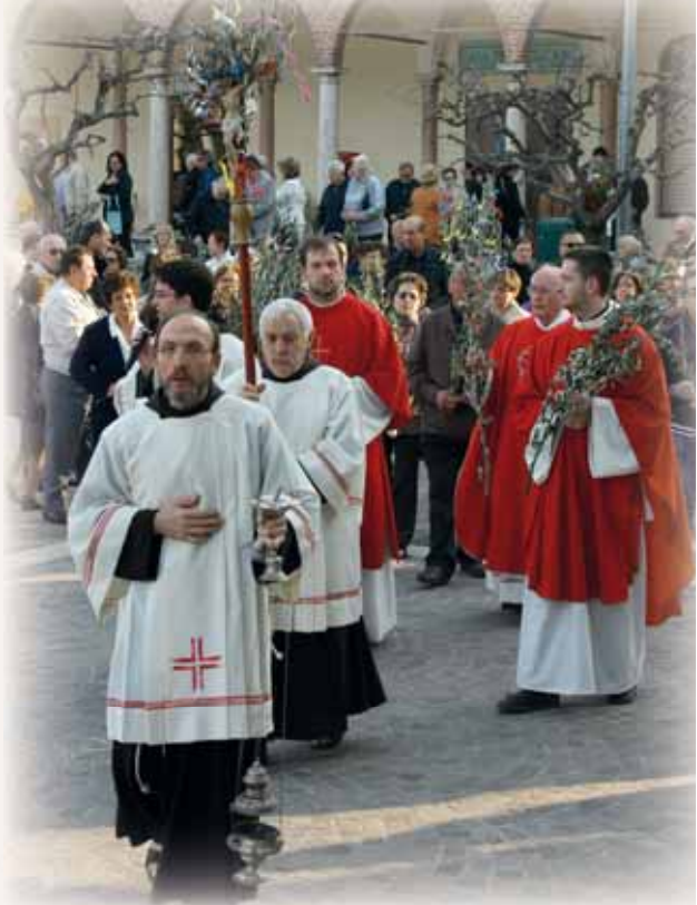
La Benedizione e Processione delle Palme

Suggestiva e molto partecipata dai fedeli la benedizione degli ulivi nel piazzale del Santuario e la Processione verso la Chiesa dove è stata celebrata la S. Messa. Questo rito che ogni anno la Chiesa ripete è sempre coinvolgente. Il nostro è stato un cantare e acclamare: “Benedetto colui che viene nel nome del Signore”. I fedeli accorsi numerosissimi a tutte le SS. Messe in questo giorno si sono portati a casa l’ulivo benedetto, come segno di pace, come ricordo di una festa a cui hanno partecipato. E’ bello vedere nelle nostre case l’ulivo esposto; mi auguro sia un segno forte per tutti.