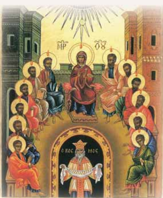
Icona della Pentecoste

La festa è caratterizzata come sempre dalla Celebrazione della S. Messa e dalla grande Processione che ogni parrocchia e città fanno per dire grazie a Gesù Eucarestia. Il suo passare tra le nostre case è segno di una benedizione e protezione che chiediamo a Colui che è sempre ben disposto nei nostri confronti. E' anche un'occasione per ricordare ai cristiani più sensibili che la preghiera fatta davanti all'Eucarestia diventa un facile dialogo tra Gesù che è là presente e il cristiano e la comunità che lo adorano.