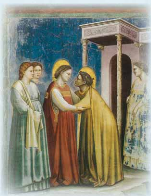
Visita di Maria ad Elisabetta "Giotto" Cappella degli Scrovegni (PD)

voce: «Benedetta tu tra le donne, e benedetto il frutto del tuo grembo» (cfr. Lc 1,40-42). Questa esclamazione o acclamazione di Elisabetta sarebbe poi entrata nell'Ave Maria, come continuazione del saluto dell'angelo, divenendo così una delle più frequenti preghiere della Chiesa. Ma ancor più significative sono le parole di Elisabetta nella domanda che segue: «A che debbo che la madre del mio Signore venga a me?» (Lc 1,43). Elisabetta rende testimonianza a Maria: riconosce e proclama che davanti a lei sta la Madre del Signore, la Madre del Messia. A questa testimonianza partecipa anche il figlio che Elisabetta porta in seno: «Il bambino ha esultato di gioia nel mio grembo» (Lc 1,44).