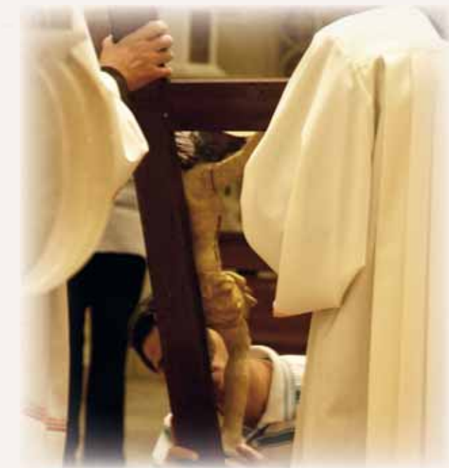
Bacio della croce a termine della Via Crucis