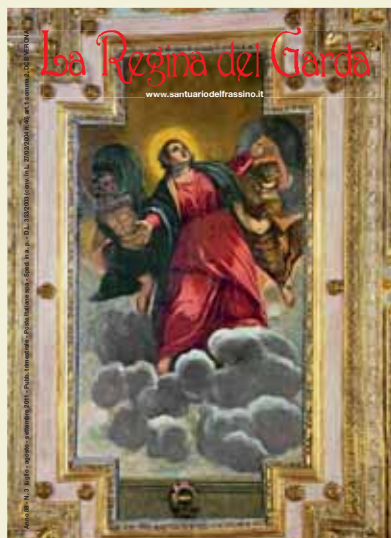
SANTUARIO MADONNA DEL FRASSINO - Peschiera del Garda (Verona)

Assunzione di Maria (Giovanni Andrea Bertanza) Particolare della cappella della Madonna Santuario del Frassinio