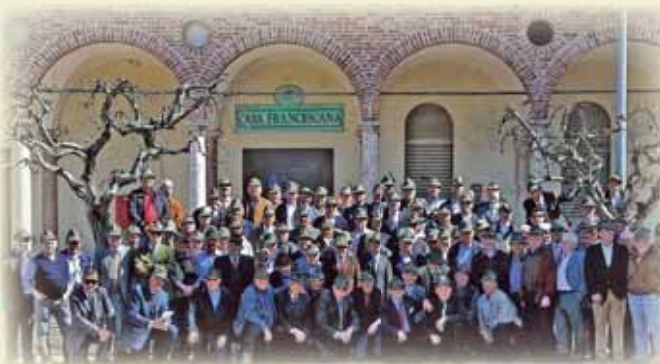
Gruppo alpini classe 1938 che negli anni '60 erano nel batt.ne Bassano di San Candido (BZ)

In questi cinque secoli di storia la Madonnina ha visto tanti suoi devoti e