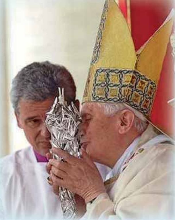
Il Papa che bacia la reliquia di Giovanni Paolo II

duce a Lui, a condizione che si viva il suo mistero in Cristo. Il trattato di San Luigi Maria Grignion de Montfort può disturbare con il suo stile un po' enfatico e barocco, ma l'essenza delle verità teologiche in esso contenute è incontestabile. L'autore è un teologo di classe, il suo pensiero mariologico è radicato nel Mistero trinitario e nella verità dell'incarnazione del Verbo di Dio. Compresi allora perché la Chiesa recita l'Angelus tre volte al giorno. Capii quanto cruciali siano le parole di questa preghiera: «L'Angelo del Signore portò l'annuncio a Maria. Ed ella concepì per opera dello Spirito Santo... Eccomi sono la serva del Signore. Avvenga di me secondo la tua parola... E il Verbo si fece carne, e venne ad abitare in mezzo a noi...» Parole davvero decisive! Esprimono il nucleo dell'evento più grande che abbia avuto luogo nella storia dell'umanità. Ecco spiegata la provenienza del Totus