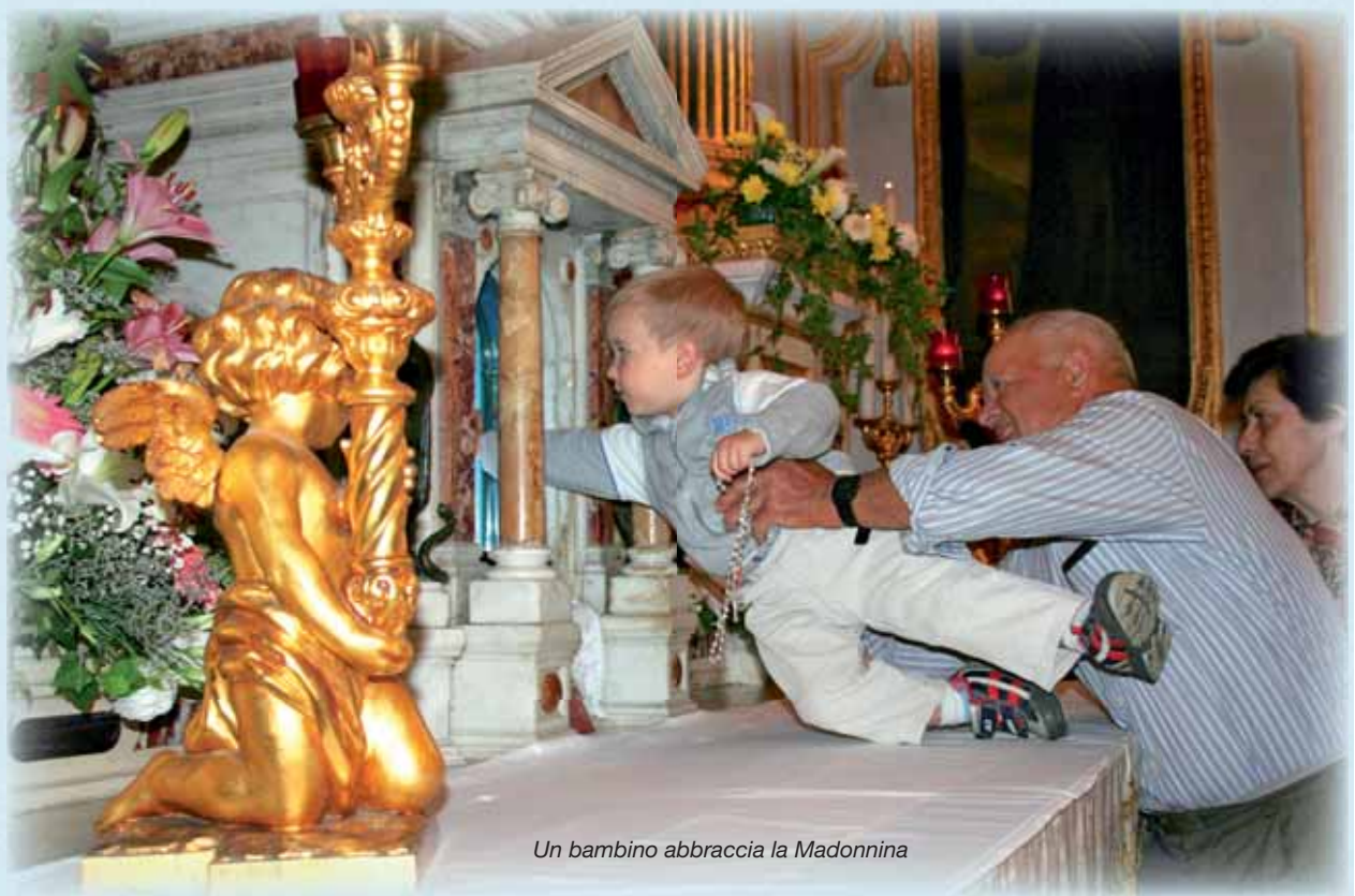
Un bambino abbraccia la Madonnina

Anche la S. Messa delle ore 21 è stata partecipata e sentita dai cristiani che gremivano il Santuario venuti particolarmente dalle Parrocchie del B. Andrea e di S. Benedetto in Peschiera.