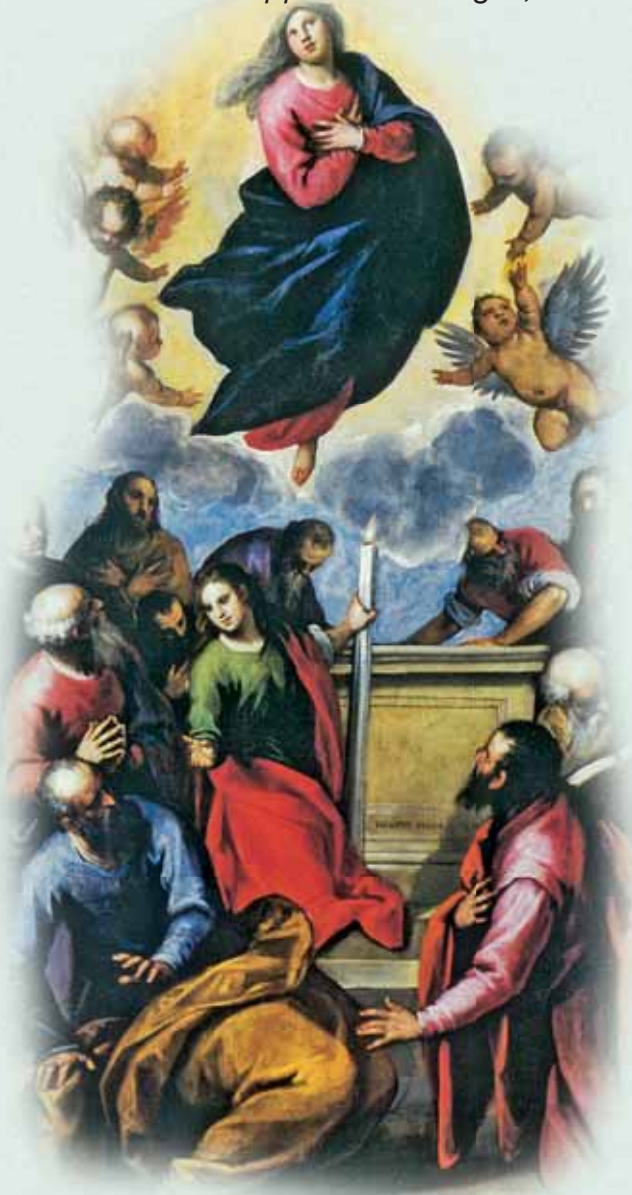
L'Assunta di Jacopo Negretti, detto Palma il Giovane, sull'altare della cappella dell'Apparizione. Santuario dei Miracoli - Motta di Livenza (TV)

sulla croce, lei che, preservata dal dolore, quando lo diede alla luce, fu trapassata dalla spada del dolore quanto lo vide morire, Era giusto che la Madre di Dio possedesse ciò che appartiene al Figlio,