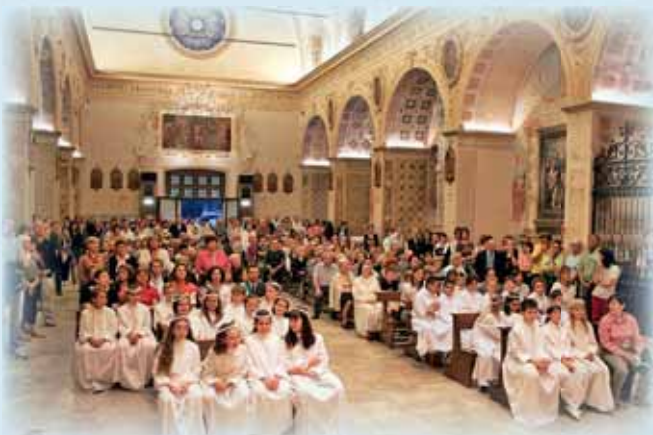
Bambini della 1° comunione

Nel mese di maggio in media abbiamo avuto 8-9 pellegrinaggi al giorno. Particolarmente significativi quelli della sera, partecipati a turno dalle Parrocchie della zona. Ogni sera la chiesa era piena di fedeli. L'incontro iniziava con il S. Rosario recitato camminando per dare il senso del pellegrinaggio, trovava il suo punto focale nella celebrazione della S. Messa, e si concludeva con un atto di affidamento dei bambini, per lo più della Prima comunione, fatta ai piedi della Madonnina del Frassino. Bellissimo il coinvolgimento di diverse Parrocchie dove c'era la presenza di ragazzi della Cresima e dei bambini di Prima Comunione e della Prima Confessione. Il coinvolgere tutti i ragazzi di questi sacramenti con i genitori e altri parrocchiani rende il pellegrinaggio parrocchiale particolarmente espressivo. Tante Parrocchie sono venute con le corali. Ogni sera voci diverse, volti diversi, mondi interiori diversi tutti qui ad attingere dall'Eucaristia la forza, da Maria la protezione.