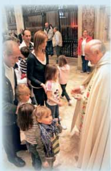
Benedizione dei bambini

ha ricordato che Maria è modello della Chiesa. Amare Maria significa amare la Chiesa, vivere e operare nella Chiesa. "Non dobbiamo vergognarci di essere cristiani" ma forti della grazia del Signore testimoniare gioiosamente che solo in lui l'uomo può trovare le giuste risposte.