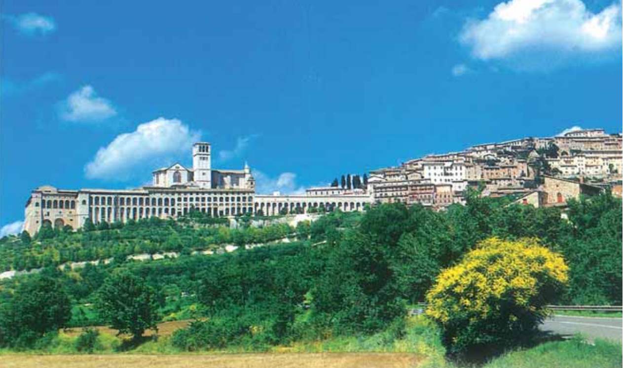
Un suggestiva vista di Assisi

I diversi incontri che si sono succeduti nello “Spirito di Assisi”, intesi come “tasselli” per la costruzione di cammini di riconciliazione e di pace mediante il dialogo tra le varie religioni, ad una prima impressione, potrebbero sembrare “via” poco efficace che poco va a toccare i problemi reali dei popoli. L’attuale Pontefice, invece, ci ricorda come il raggiungimento di un maturo senso religioso vada a favorire la promozione di relazioni di universale fraternità: in tutte le grandi tradizioni religiose, infatti, si registra un intimo legame tra il rapporto con il Trascendente e una concreta “etica dell’amore” verso i fratelli.